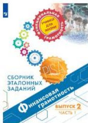
Финансовая грамотность. Сборник эталонных заданий. Выпуск 2. Часть 1