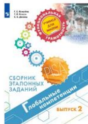
Глобальные компетенции. Сборник эталонных заданий. Выпуск 2