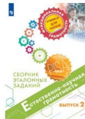
Естественно-научная грамотность. Сборник эталонных заданий. Выпуск 2