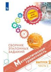
Математическая грамотность. Сборник эталонных заданий. Выпуск 2. Часть 2