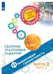
Финансовая грамотность. Сборник эталонных заданий. Выпуск 2. Часть 2