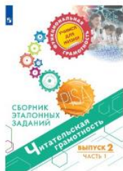
Читательская грамотность. Сборник эталонных заданий. Выпуск 2. Часть 1