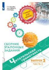
Читательская грамотность. Сборник эталонных заданий. Выпуск 2. Часть 2