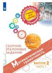
Математическая грамотность. Сборник эталонных заданий. Выпуск 2. Часть 1